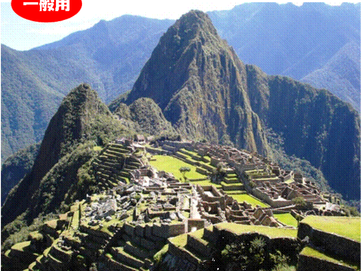
マチュ・ピチュ (ペルー/世界文化遺産)