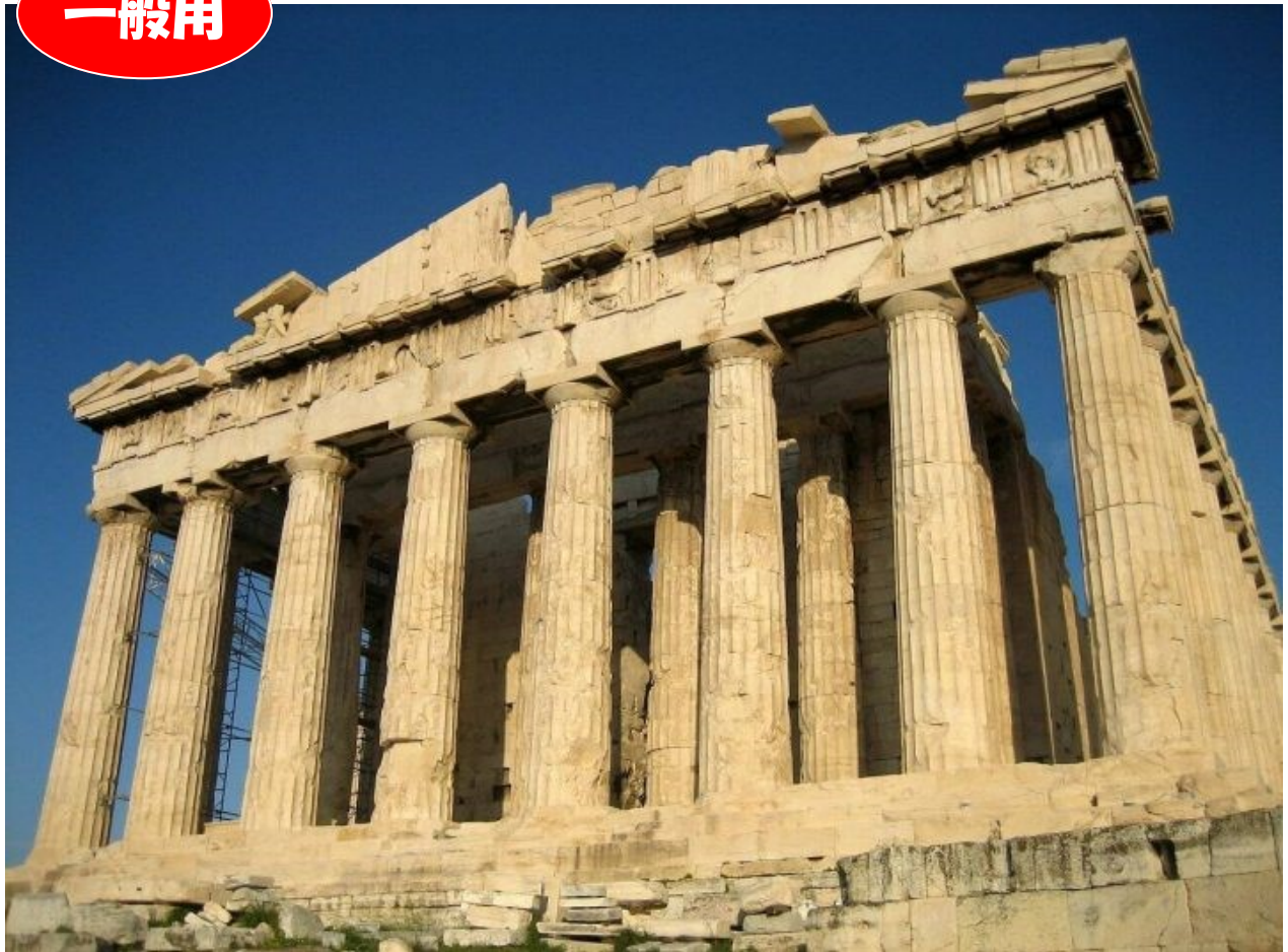
アクロポリス - アテネ (古代オリンピック発祥の地ギリシャ/世界文化遺産)