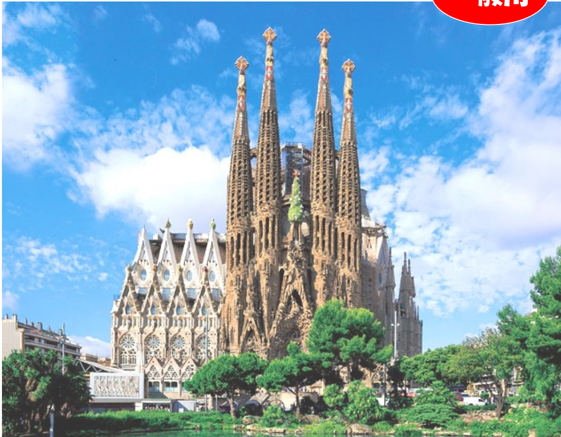
サグラダ・ファミリア (スペイン/世界文化遺産)