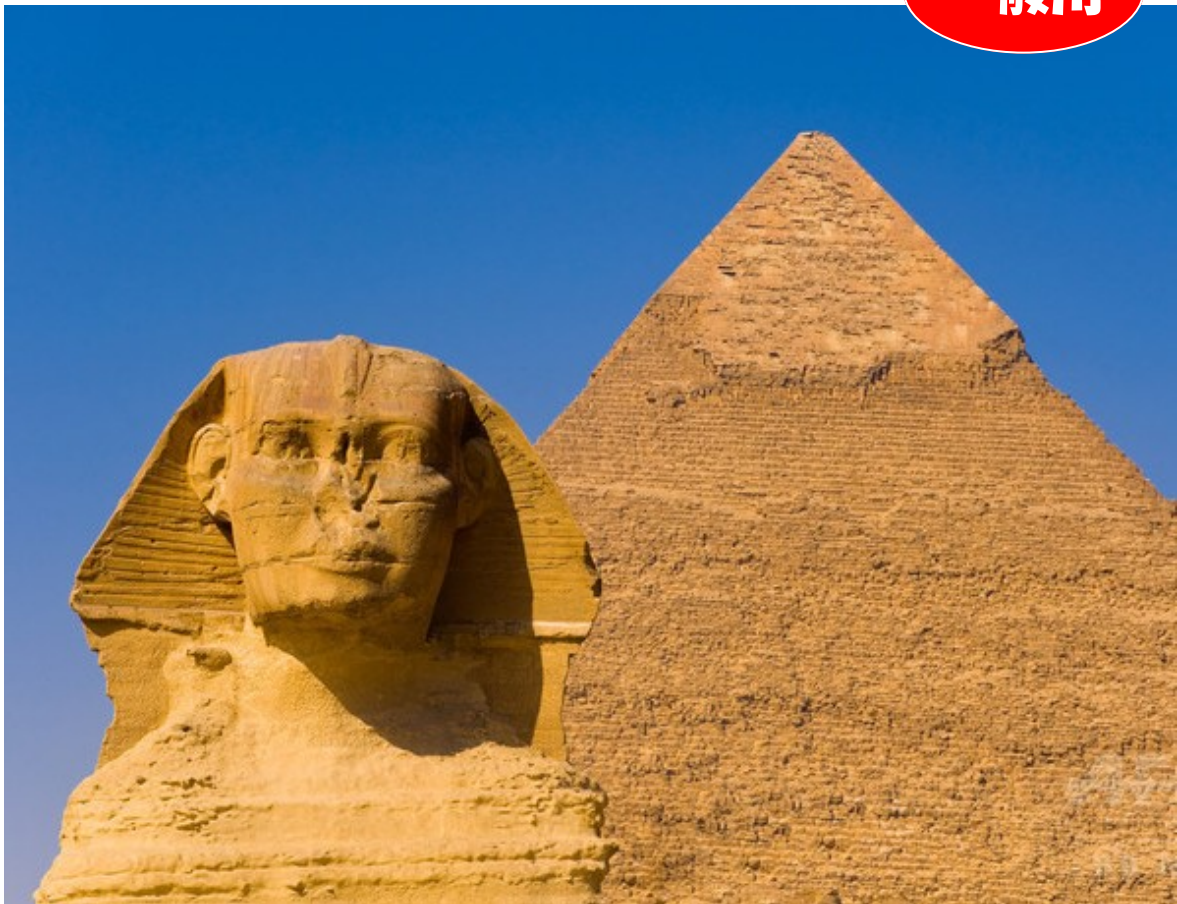
ギザの大スフィンクスとカフラー王のピラミッド（エジプト/世界文化遺産）